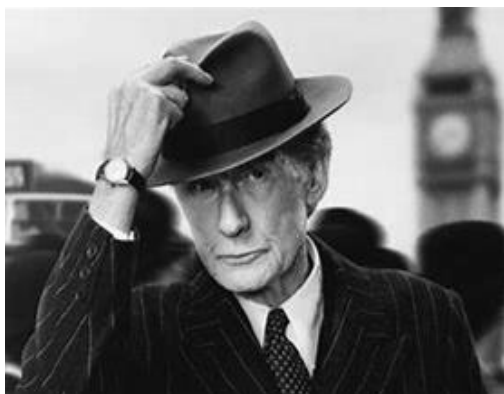
『生きる living』のビル・ナイ(1949~)

イシグロはノーベル賞の受賞講演でハワード・ホークスの『特急二十世紀』(一九三四)にふれている。ビル・ナイが転職したマーガレットと見る映画にも同監督の『僕は戦争花嫁』(一九四九)を選んでいる。彼の小説に映画が大きく影響を与えていることがうか