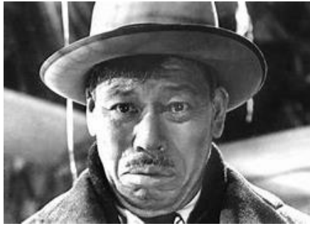
『生きる』での志村喬(1905~1982)

それにしても、役者たちの演技がすばらしい。志村の息子役金子信雄ですら影がうすい。以下、何人かのエピソードを記しておく。 志村喬 この時、四七歳である。父が三菱生野鉱業所の冶金技師で朝来の生野生まれ。ちなみに橋本忍は下流の市川の生まれで、各々記念館が生地にある。祖父は山内容堂の臣下で、鳥羽伏見の戦いで隊長として出陣している。「ゴンドラの唄」(ビル・ナイはスコットランド民謡「ナナカマドの木」)を二回歌うが、マキノ雅弘のオペレッタ時代劇『鴛鴦歌合戦』(一九三九)でもたっぷり歌っている。共演のディック・ミネの推薦でテイチクからスカウトされたほど。 『男はつらいよ』には、博の国文学者の父親役で4本に出演している。中でも妻の葬儀に家族が備中高梁に集まる『寅次郎恋歌』(一九七二)は、小津の『東京物語』とほぼ同じ設定である。笠智衆も小津映画の中で何度も歌っている。尾道と高梁は直線距離で50キロばかり。 小田切みき 志村に生きるエネルギー